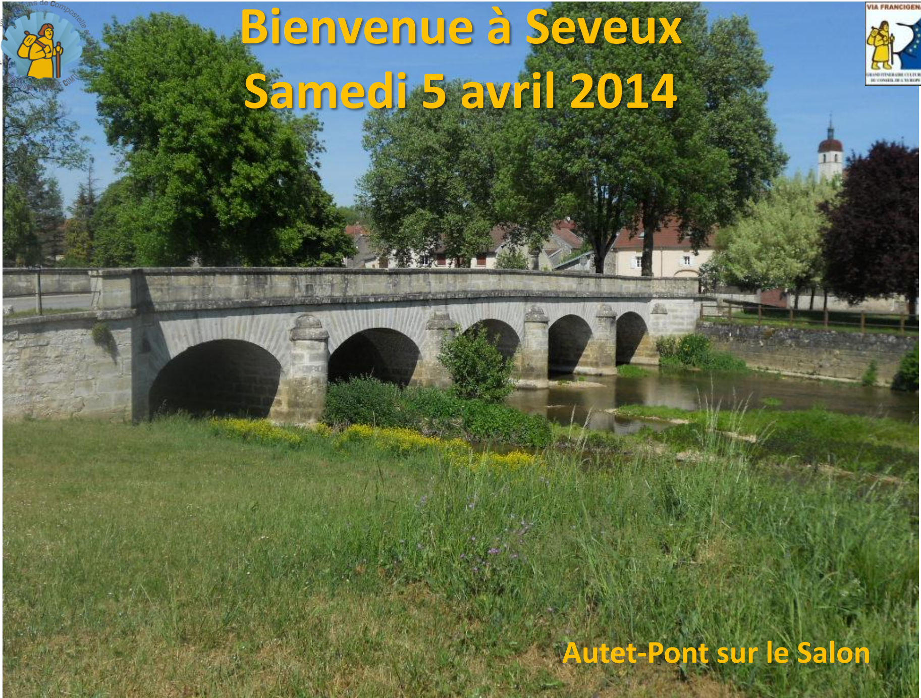
Autet-Pont sur le Salon