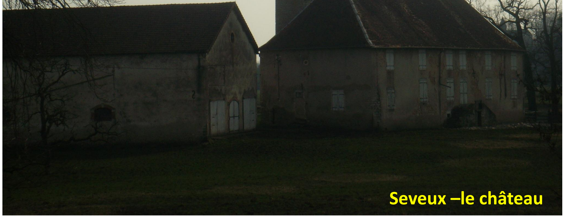
Seveux –le château